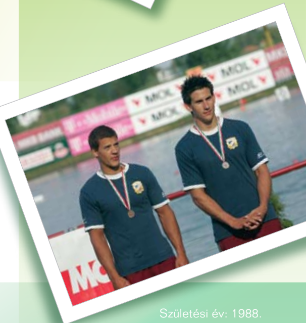
Születési év: 1988. Lakóhely: Budapest Sportág: kajak-kenu