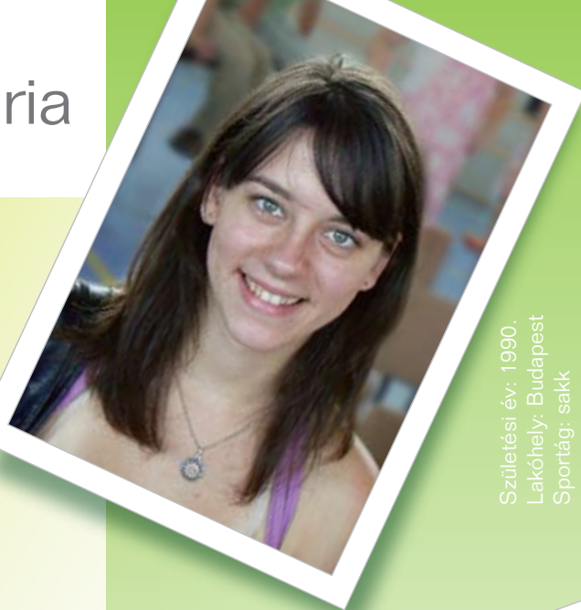
Születési év: 1990. Lakóhely: Budapest Sportág: sakk

Mária a magyar sakksport egyik legígéretesebb fiatal tehetsége, aki rövid idő alatt nagyon komoly fejlődést ért el. Tíz évvel ezelőtt szülei ösztönzésére kezdett el sakkozni. Édesapja ugyanis úgy gondolta, hogy a sakk lányai – Máriának van egy ikertestvére – hasznára válhat, hiszen logikus gondolkodásra tanít, fejleszti az elmét és a koncentrációképességet, valamint segít a kudarcélmények feldolgozásában. A hobbiból azonban hamar hivatás lett, Mária ugyanis rövid idő alatt sikert sikerre halmozott a versenyeken. Korosztályában mára hétszeres országos egyéni bajnok, rapidban pedig négyszeres győztes. Eredményes résztvevője a junior és felnőtt versenyeknek is, a legutóbbi Magyar Felnőtt Női Bajnokságon a harmadik helyet szerezte meg a rendkívül erős, nála tapasztaltabb mezőnyben. Mária legfontosabb célja, hogy bekerülhessen a női olimpiai csapatba, és képviselhesse hazánkat a 2008-as Sakk Olimpián. A fiatal sakkozó sikerei tehetségén kívül a napi többórás edzéseknél és szülei támogatásánál köszönhetőek. Ahhoz, hogy lépést tudjon tartani korosztályának versenyzőivel, rendszeres nemzetközi megmérettetésekre van szüksége. A nevezési díjak és útiköltségek komoly terhet rónak a családra. Mária ezért 2007-ben a nemzetközi versenyeken való részvételéhez kapott támogatást.